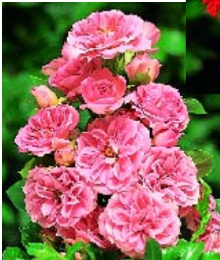
◀ Pink Meillandina