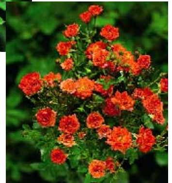
Colibri 79 ▲