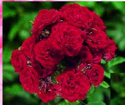
◀ Prince Meillandina