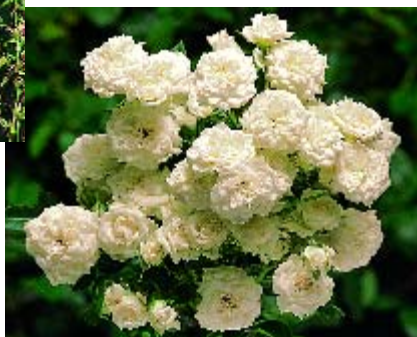
Alba Meilandina ►