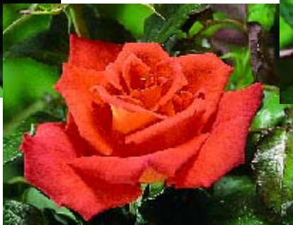
Monica - p. 15 ▶