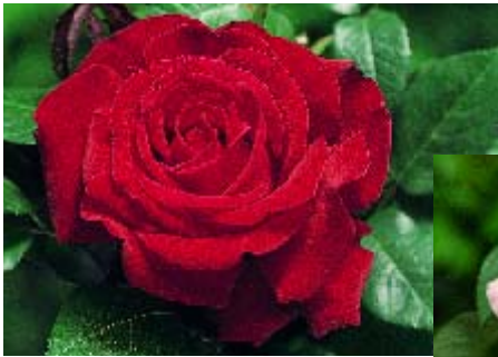
Ingrid Bergmann - p. 14 ▲