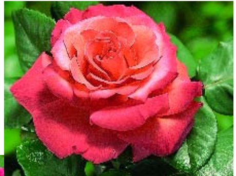
▲ Christophe Colomb p. 13