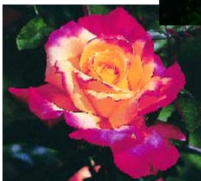
◀ République de Genève - p. 16