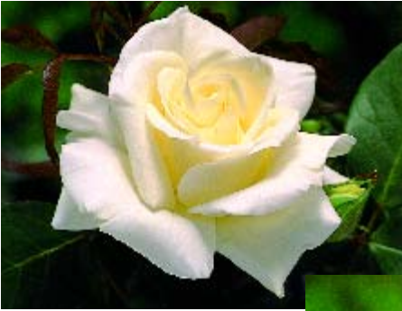
Evening Star - p. 14 ▲