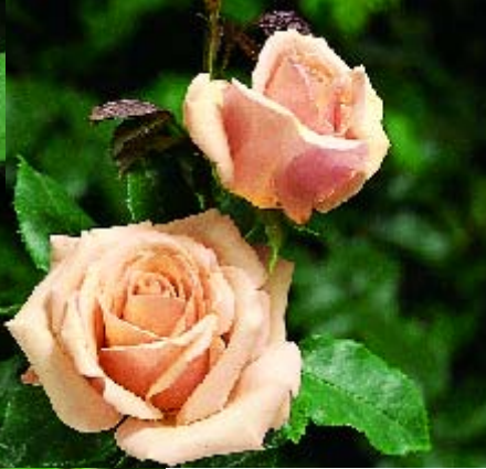
< Paul Ricard - p. 15