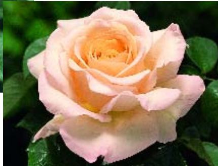
◀ Jardins de Bagatelle - p. 14