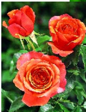
Cherry Brandy - p.13 ►