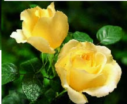
Elina - p. 14 ►