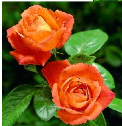
Louis de Funès - p.15 ▼