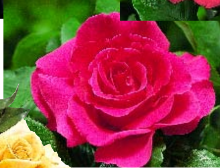
◀ Fragola - p. 14