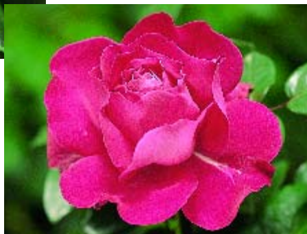
Baronne E. de Rothschild - p. 13 ▲