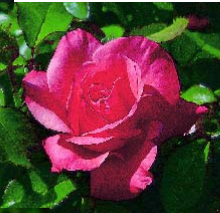
◀ Silver Jubilé - p. 16