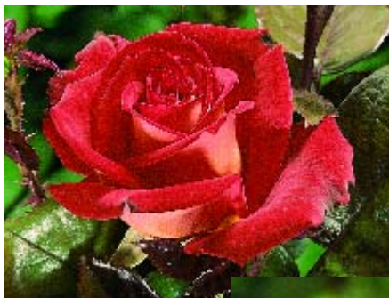
Bicolette - p. 13 ▲