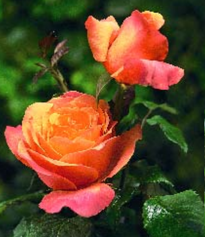
◀ Lolita - p. 15