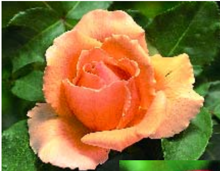
Just Joey - p. 14 ▲