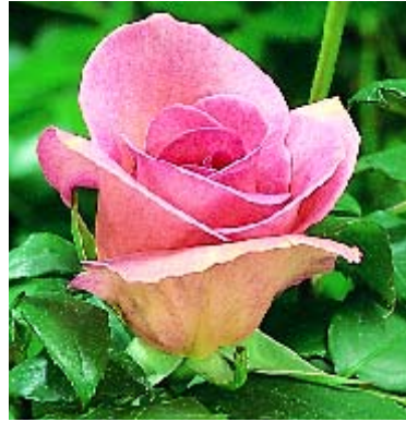
Summer Lady - p. 17 ▲