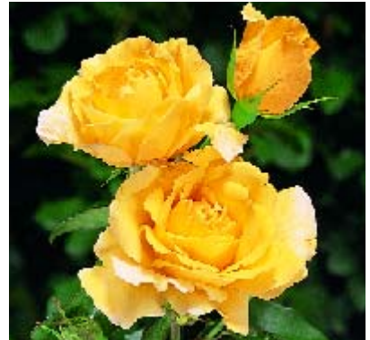
Duftgold - p. 14 ▲