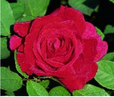
Mister Lincoln - p. 15 ▲