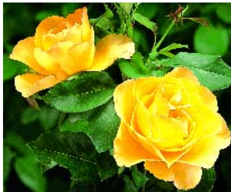
◀ Soleil de Sierre - p. 16