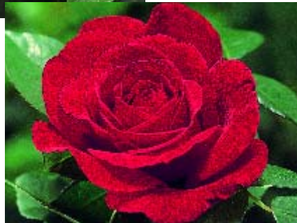
Fulgurante - p. 14 ▲