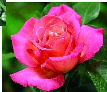
Chicago Peace - p.13 ▲