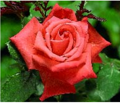
◀ Remembers Liverpool - p. 16