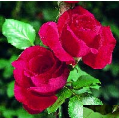
Senator Burda - p. 16 ▲