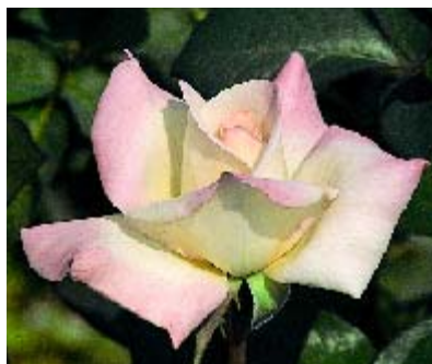
Pristine - p. 16 ▲