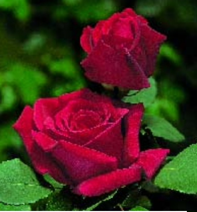
< Papa Meilland - p. 15