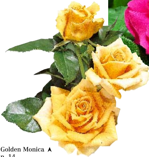
Golden Monica ▲ p. 14