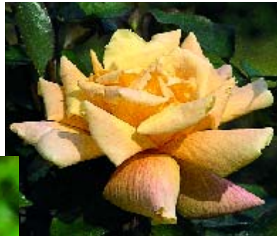
▼ Sutter's Gold - p. 17