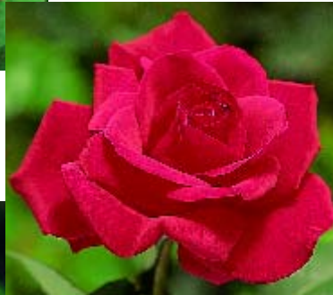
◀ St-Victor - p. 17