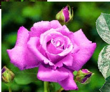
Charles de Gaulle p. 13 ►