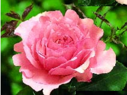
West Coast - p. 17 ▲