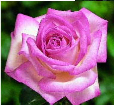
< Princesse de Monaco - p. 16