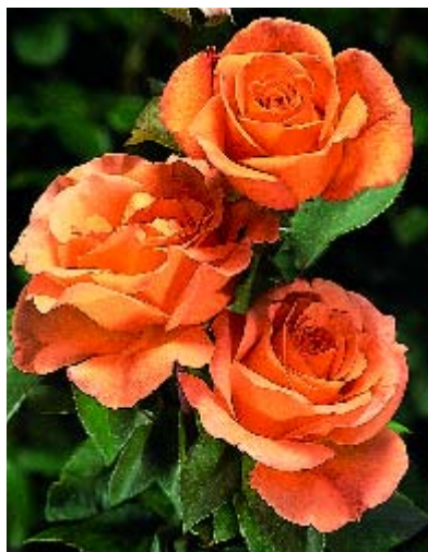
Whisky - p. 17 ▲