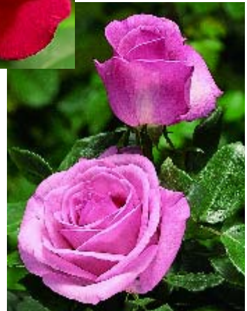
Tino Rossi - p. 17 ▲