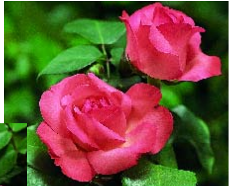
Pink Panther - p. 16 ▼