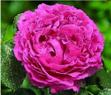
Yves Piaget - p. 17 ▲