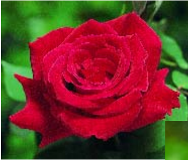
Rouge Meilland - p. 16 ▲