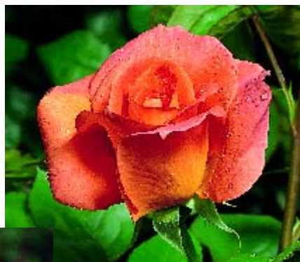
Belle Vaudoise - p. 13 ▲

Massifs, plates-bandes ou fleurs coupées, ici la reine des fleurs se plaît à exprimer toute sa beauté