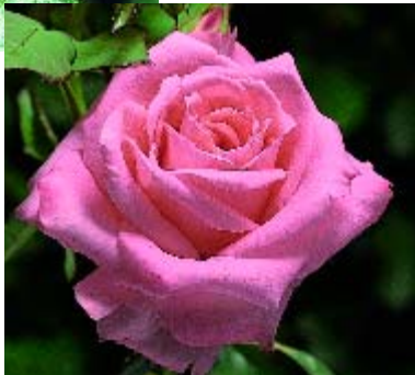
Sonia Meilland - p. 16 ►