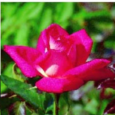
Acapella - p. 13 ▲