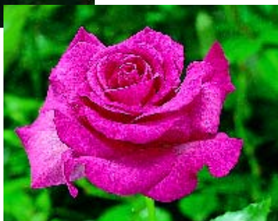
Mélo die Parfumée - p. 15 ▲