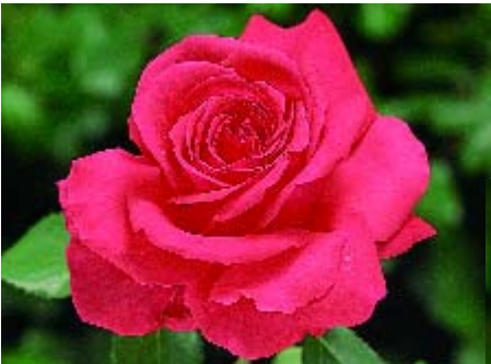
Duftwolke - p. 14 ▲