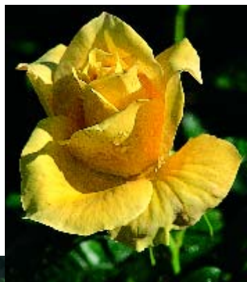
Rose d'or de Montreux - p. 16 ▼