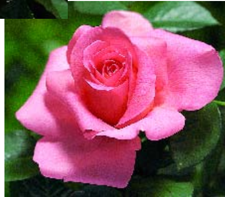
Francia - p. 14 ▲